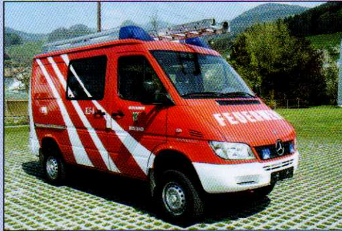
Einsatzfahrzeug der FFW Müselbach in Österreich