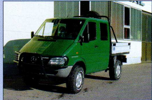
Doppelkabiner eines Forstwirtschaftsbetriebes