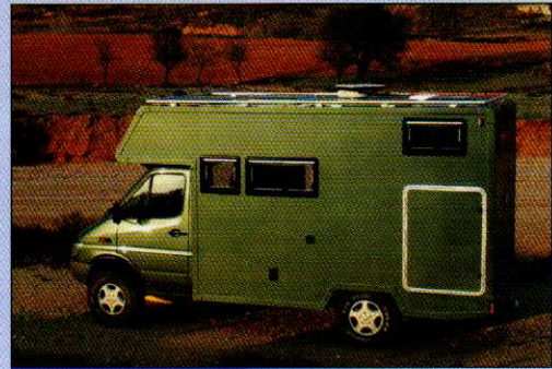
Spanientrip mit dem Fernreisemobil