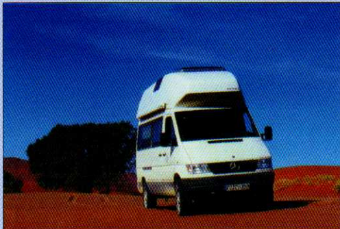
Trip durch Sossuvlee im Naukluft-Park von Namibia