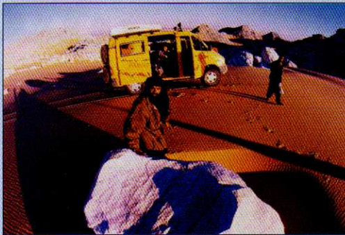
Das Filmteam zu „Der Rebell in der Wüste“