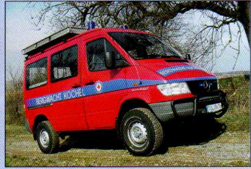
Das Rettungsfahrzeug der Bergwacht Kochel