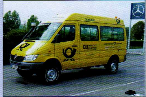
Begleitfahrzeug der Deutschen Post AG